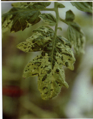
Вирус на мозаикот на тутунот ( Tobacco mosaic virus )