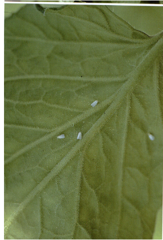
Белокрилка ( Trialeurodes vaporariorum )