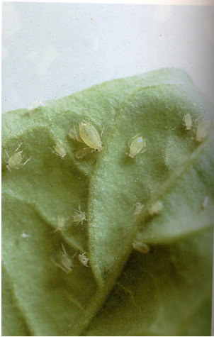
Лисни вошки ( Myzus persicae )