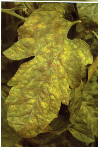
Лисна мувла ( Fulva fulva )