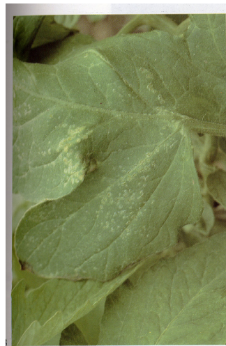
Бактериозно венење и рак ( C. michiganense subsp. Michiganense )